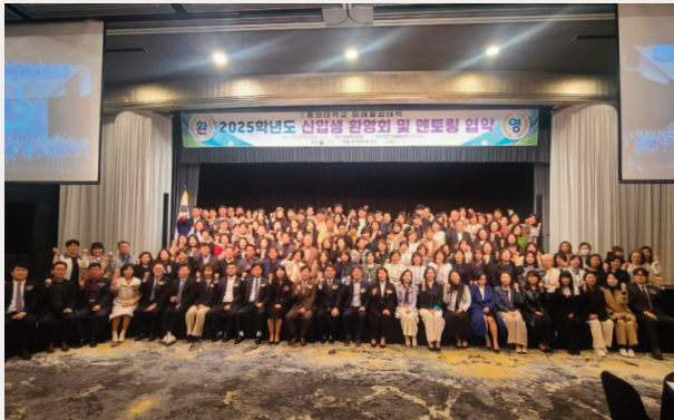
▲ 2025학년도 신입생 환영회