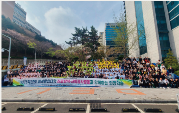
▲ 2025학년도 현장학습