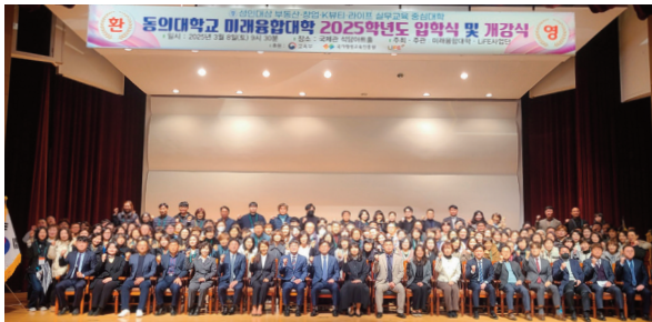
▲ 2025학년도 입학식 및 개강식